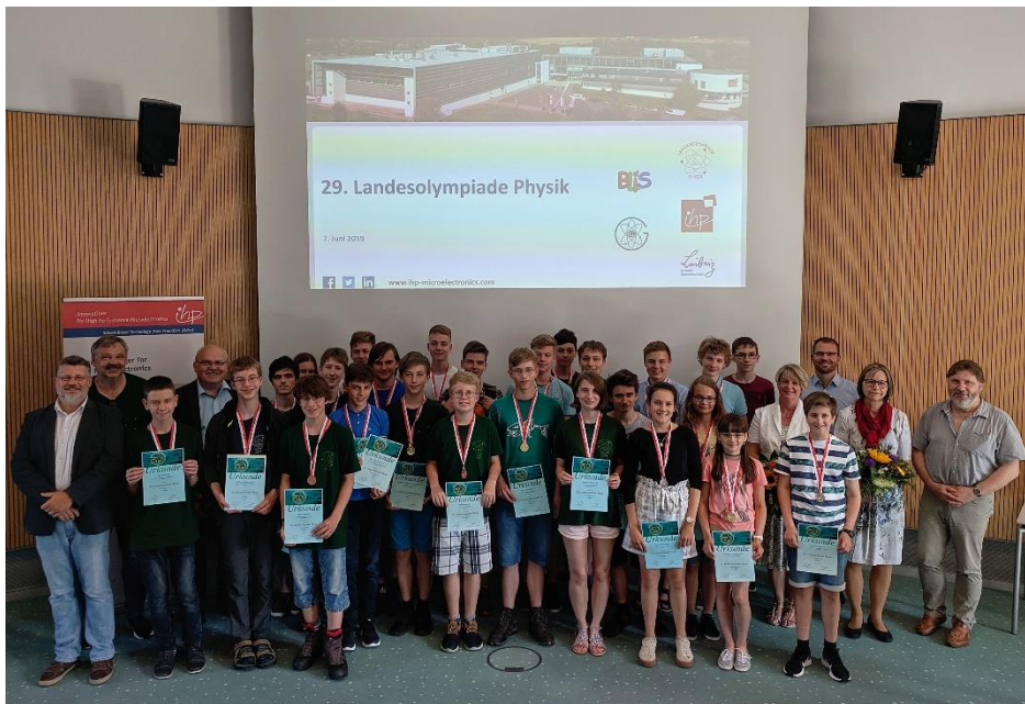
Glückliche Schülerinnen und Schüler bei der Siegerehrung der Landesolympiade Physik 2019 im IHP.